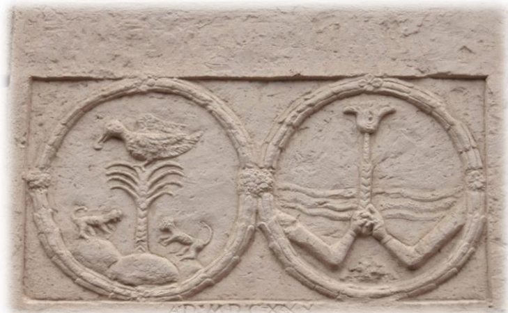
Obrázok 5: Erb rádu pavlínov z roku 1630 na múre hornolefantovského kaštieľa