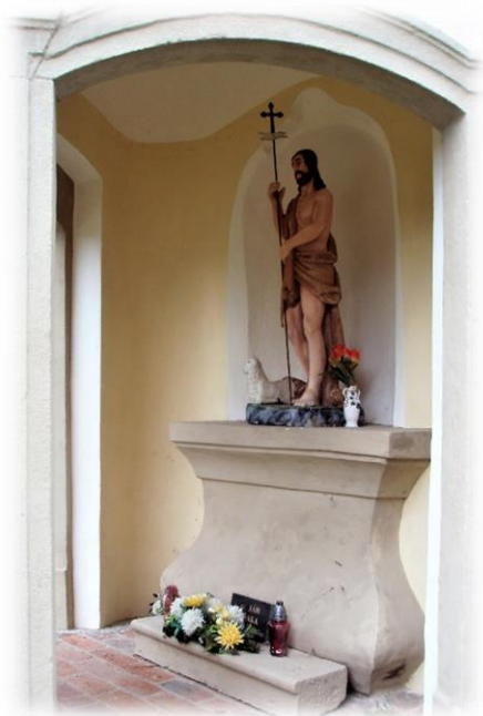
Obrázok 4: Kaplnka sv. Jána Krstiteľa v Horných Lefantovciach

V roku 1369 do obce prišli mnísi rehole pavlínov (rehoľa bratov sv. Pavla založenej v Uhorsku) a v osade Sanctus Johannes (zal. 1353) vybudovali Kláštor sv. Jána Krstiteľa.